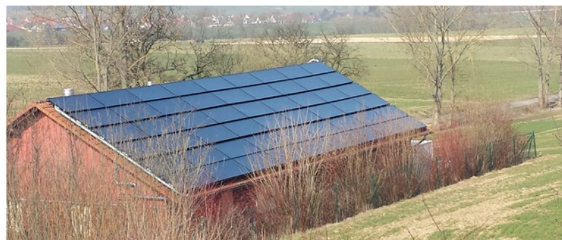
GDRA Neu-Eichenberg, 155 m 2 Solarkol. und 120 kW Gas-WP, 2015