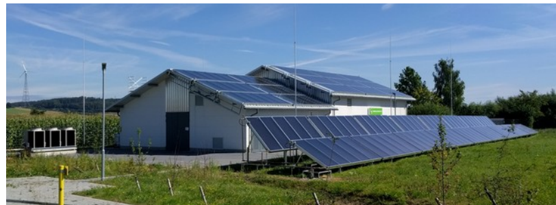
GDRA Ostheim, 421 m 2 Solarkollektoren und 120 kW Gas-WP, 2016