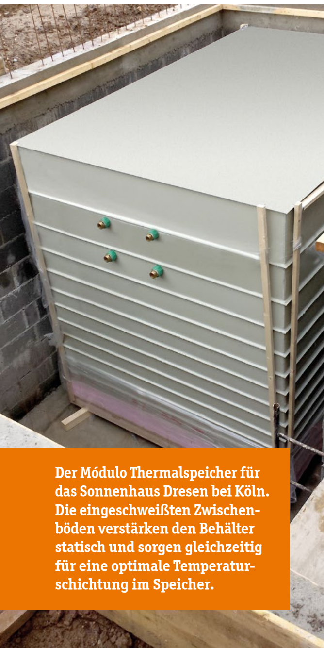
Der Módulo Thermal Speicher für das Sonnenhaus Dresen bei Köln. Die eingeschweißten Zwischenböden verstärken den Behälter statisch und sorgen gleichzeitig für eine optimale Temperaturschichtung im Speicher.