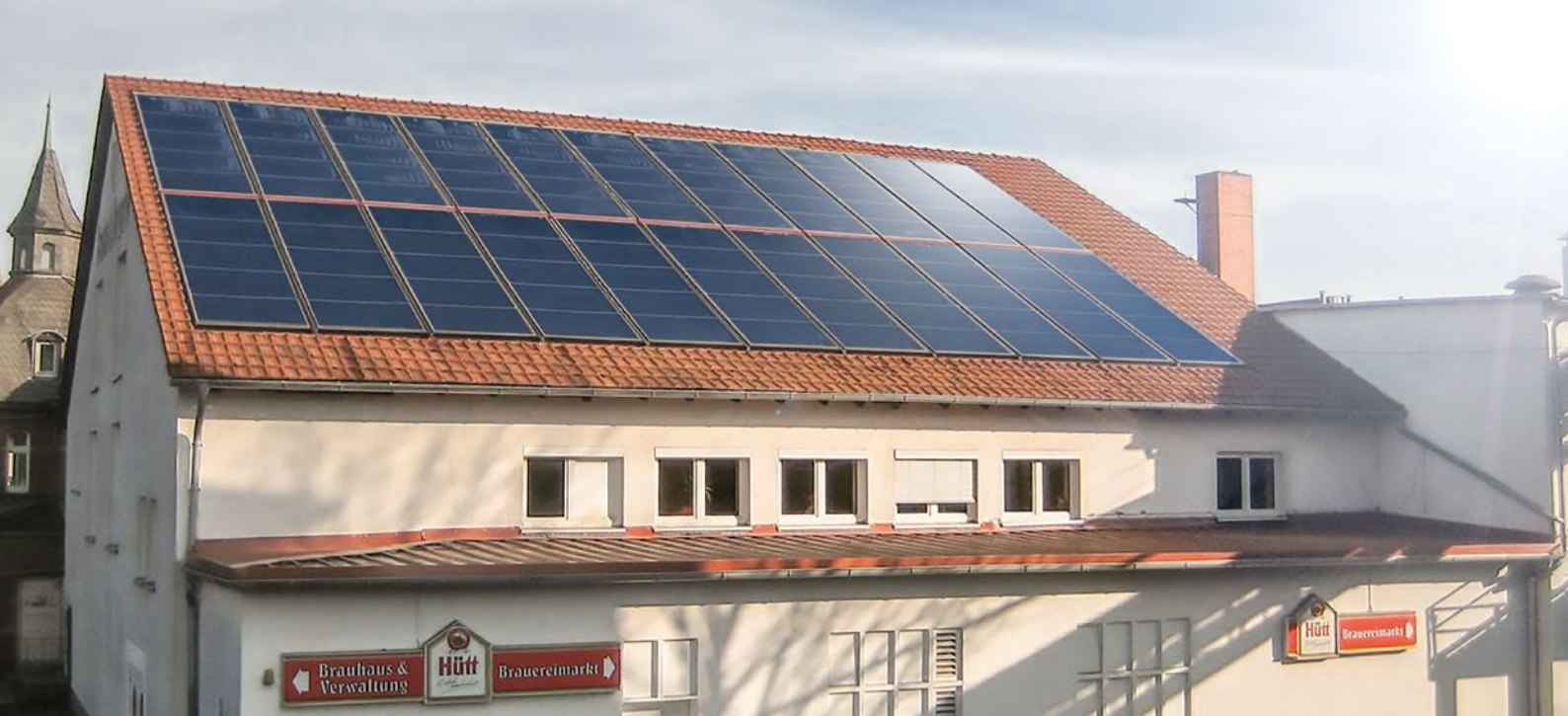
Flachkollektoren auf dem Dach der Hütt-Brauerei in Baunatal. Hütt nutzt eine solarthermische Anlage zur Vorerwärmung des Brauwassers.