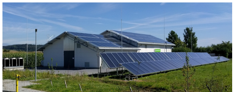
GDRA Ostheim, 421 m 2 Solarkollektoren / 120 kW Gas-WP, 2016