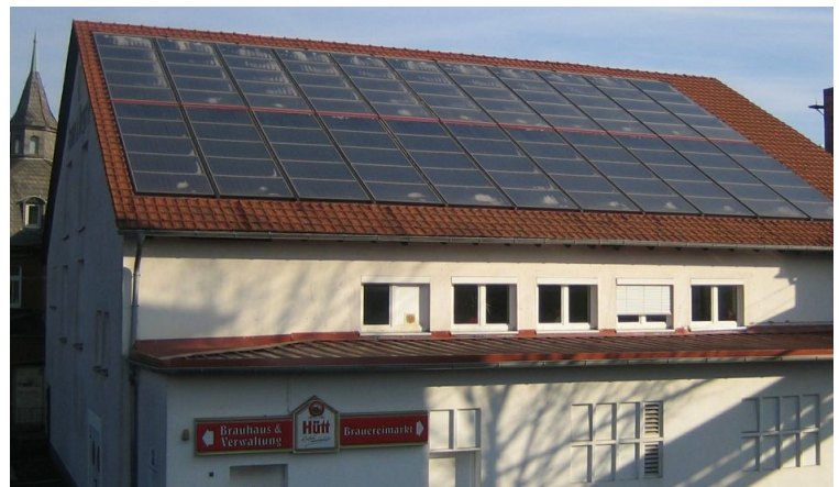
Solarthermische Wärme in der HÜTT Brauerei Kassel, 2011

Wirtschaftlichkeit Wärmebedarf für den Prozess: ca. 360.000 kWh/a Solare Deckungsrate: 25% Wärmegestehungskosten: 2,8 ct/kWh